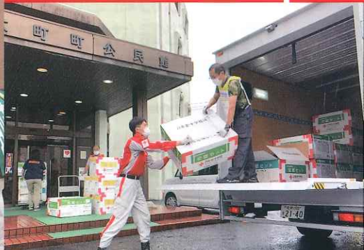
令和3年8月大雨災害救護(佐賀県)