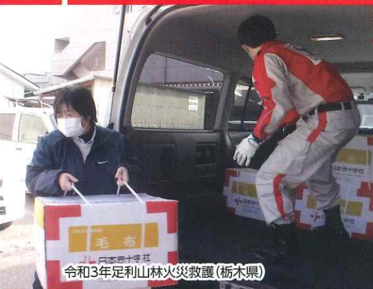
令和3年足利山林火災救護(栃木県)

緊急事態を引き起こした感染症、頻発する自然災害 いかなる状況下でも、ひとりでも多くの、苦しんでいる人を救うため、 どうか、赤十字活動資金への温かいご協力をお願いいたします。