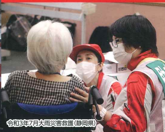
令和3年7月大雨災害救護(静岡県)