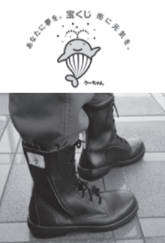
消防団に配備された半長靴