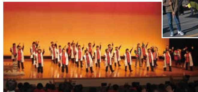
◀ ステージでのお披露目