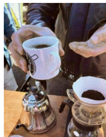
◀ こだわり、淹れたてのコーヒーが味わえる