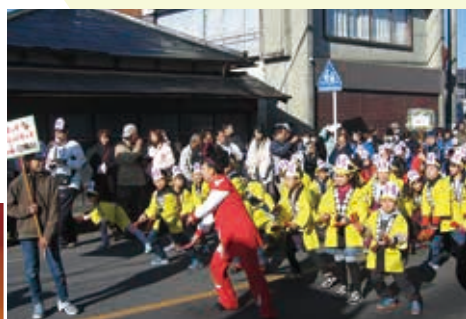
▲ キッズ達はさつまいものお面でPR♪

12月10日、「第18回よさこい藤岡パレード」が開催され、57チーム、650人が藤岡中央通りを練り踊りました。今年は、藤岡地域特産のさつまいもをPRしようと、鳴子の代わりにさつまいもを持って踊ったチームもあり、活気あるパレードになりました。その後、藤岡文化会館において、チーム毎に趣向を凝らした衣装や、エネルギーあふれる踊りを披露しました。