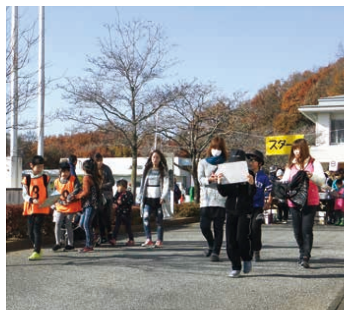
▲ 地図を片手にスタートする参加者

男の料理教室 〜できる男を目指し、中華料理に挑戦!〜 都賀公民館主催の「男の料理教室」が12月16日に開かれ、市内に住む20代〜80代の8人が、餃子と白菜スープ作りに挑戦しました。手拭いやパンダナを頭にかぶり、エプロン姿の参加者は、餃子の具を皮に包む作業に四苦八苦。形は少しいびつになりましたが、自分で作った料理の味に大満足でした。