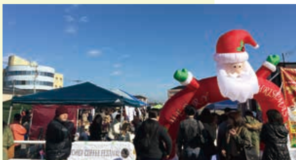
▲ 青空のもとたくさんの方が来場されました

12月9日、アメリカンフェスティバルの主催で栃木駅前北口広場を会場に「第1回 TOCHIGI COFFEE FESTIVAL」が開催されました。市内にコーヒーを提供する店が増えたことをきっかけに、コーヒーで蔵の街を盛り上げようと、市内外の16店が参加し、さらに軽食や雑貨店を集めたマルシェも同時開催されました。会場では、多くの人々が訪れ、各店のこだわりのコーヒーを堪能していました。