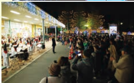
◀ 大平中学校吹奏楽部によるオープニングセレモニー

光と音のページェント 〜大切な人との特別なページ〜 12月1日、大平まちづくり交流センター(ブラッツおおひら)において「光と音のページェント」の点灯式が行われました。来場した皆様は、10万球のイルミネーションの幻想的な「光」と、大平中学校吹奏楽部の素敵な「音」を楽しんでいました。