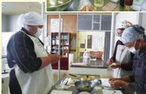
◀ 四苦八苦しなから餃子を包む参加者

男の料理教室 〜できる男を目指し、中華料理に挑戦!〜 都賀公民館主催の「男の料理教室」が12月16日に開かれ、市内に住む20代〜80代の8人が、餃子と白菜スープ作りに挑戦しました。手拭いやパンダナを頭にかぶり、エプロン姿の参加者は、餃子の具を皮に包む作業に四苦八苦。形は少しいびつになりましたが、自分で作った料理の味に大満足でした。