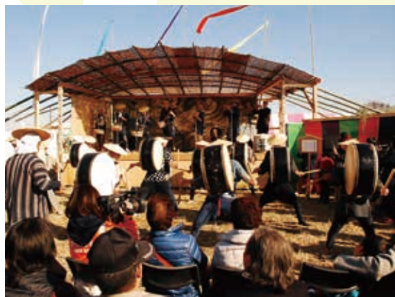
▲ 迫力ある演技が繰り広げられた農村舞台