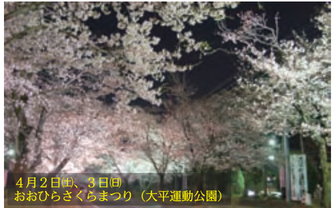
4月2日(土)、3日(日) おおひらさくらまつり (大平運動公園)