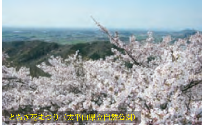
とちぎ花まつり (太平山県立自然公園)