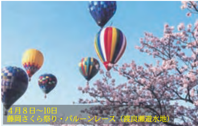
4月8日～10日 藤岡さくら祭り・バルーンレース (渡良瀬遊水地)