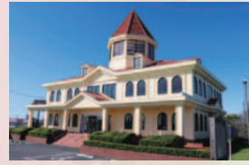
渡良瀬遊水地ハートランド城