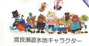
渡良瀬遊水地キャラクター