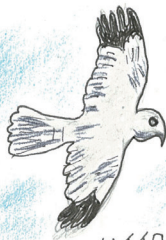
ハイイロチュウヒ