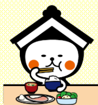
栃木市マスコットキャラクター とち介

とち介ランチは、給食で栃木市の食材や加工品を提供することにより、市の特産品を広く周知し、地域に根ざした学校給食を目指すとともに、地域を愛する心を育むことを目的としています。