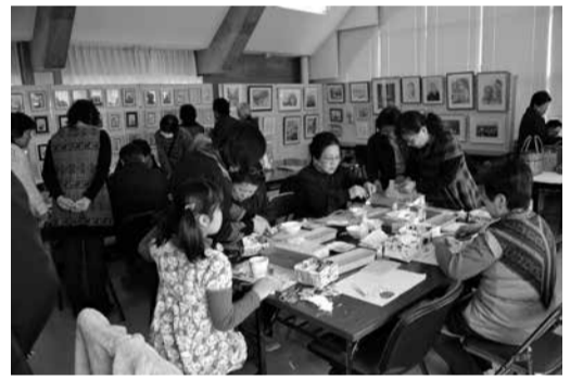
作品展示、実技発表、実演、即売、模擬店等。

第13回下野国庁まつり 郷土芸能フェスティバル 参加費 無料 問合先 大平隣保館 ☎ 43 - 6611