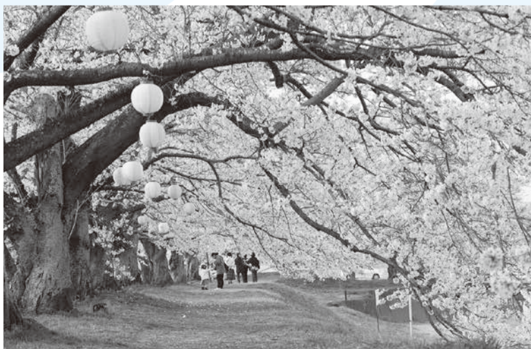
西方町観光協会 (西 産業建設課内) ☎92-0313

◆日時 4月6日(日) 10時～15時 ◆場所 金崎の桜堤 ◆内容 ○主なイベント(予定) 歌謡ショー、模擬店、フリーマーケット ★金崎のさくらは大正14(1925)年、昭和天皇のご成婚記念として金崎青年団によって植えられました。 ★約1キロにわたって堤灯に灯りがともり、夜桜も楽しめます。