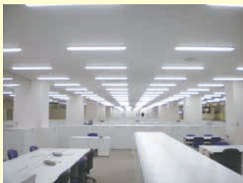
▲2階 各階は、オープンフロアになっていて、全体を見渡すことができます。 ▼事務室 事務室の床はOAフロアになっていて、パソコンの配線などは床下に収納されています。