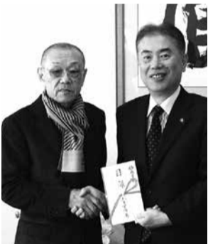
1月20日、市政振興を目的に寄付

る同社は、設立 40 周年を記念して全国 3 工場の地元施設にそれぞれ寄贈があり、本市では、工場に隣接する認定西方なかよしこども園にキッズログハウスを贈っていたいただきました。同園では、こども達がさっそくお店やさんごっこで楽しむなど、大人気の遊具となっています。ご寄附誠にありがとうございました。