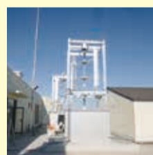
▼太陽光発電システム 議場の屋根の上に、20キロワットの同システムを設置しました。 ▲風力発電システム 発電量は6キロワットで太陽光発電システムと併せて、災害時等の電力を補完します。