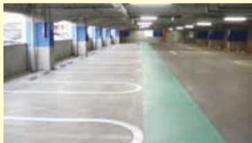
▶立体駐車場 約400台分の駐車枠があり1台のスペースを広くとっています。平面駐車場もあります。