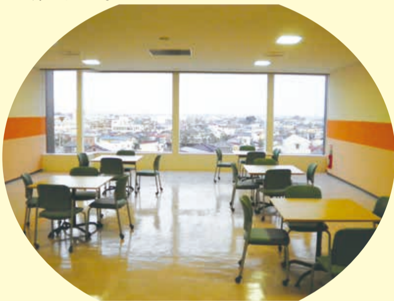
▲市民スペース 4階の大通り側に休憩スペースを設けました。大きな窓からは、蔵の街や、晴れた日には筑波山を見ることができます。