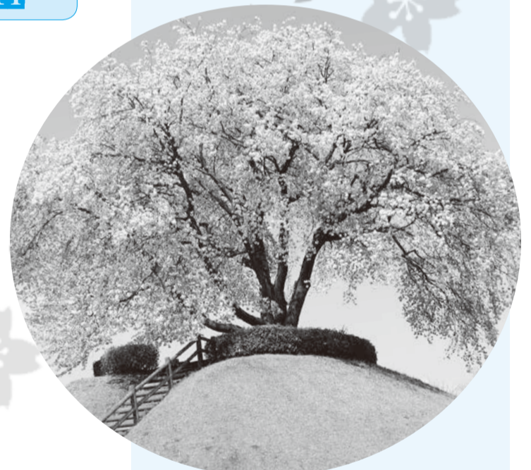
つがの里ふるさとセンター ☎92-0008