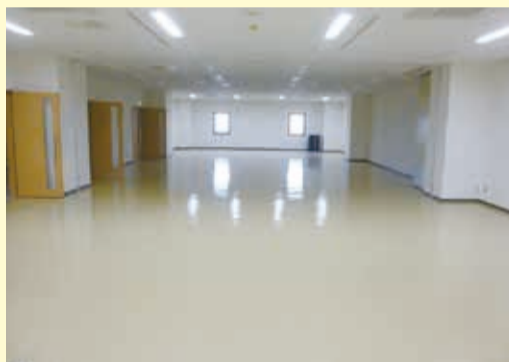
◀正庁 正庁は、庁舎で一番広い会議室です。3階にあります。