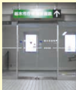
◀連絡通路 立体駐車場から庁舎へは、1階若しくは駐車場5階連絡通路からお入りください。 ※1階の工事期間中は、駐車場5階の連絡通路を利用ください。