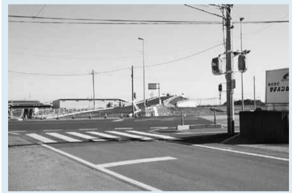
開通する市道 0-157 号線 川連側(写真①)、土与側(写真②)

この市道 0-157 号線は、広域幹線道につながり、市内各地を縫うような形の幹線道路として、約 40 年前から整備を進めてきた、全長約 30km の計画区間の一部で、唯一、未開通区間となっていました。