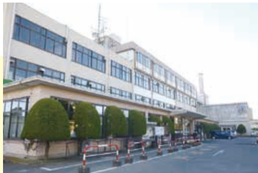
▲旧庁舎 旧庁舎は、昭和35年に建てられ、54年間市庁舎として利用してきました。