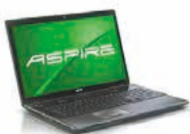
Acer Windows7 HomePremium Windows7 Professional