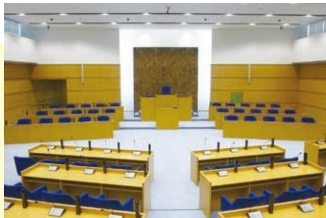
▲議場 4階には、議場をはじめ議員全員協議会室や委員会室、議会事務局など議会関係の部屋があります。