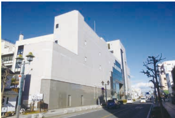
▲大通りから見た新庁舎 2月10日に新庁舎として開庁しました。