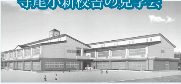
▲寺尾小新校舎完成予想図