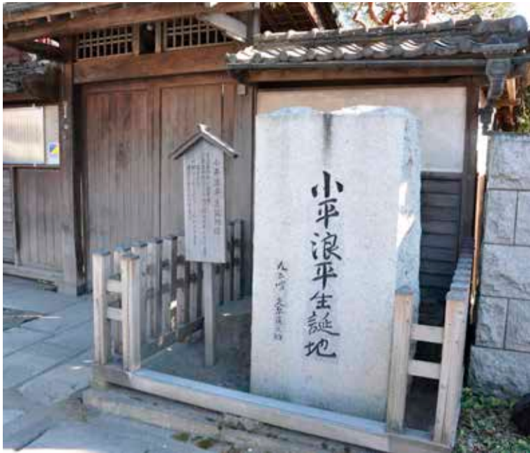
▲生家の門口に建てられた小平浪平生誕地の碑

都賀町の中心を走っている県道宇都宮亀和田栃木線(例幣使街道)沿いの合戦場郵便局前。枝ぶりのいい赤松のある民家の門口に「小平浪平生誕地」と書かれた白御影石の碑がある。小平浪平氏