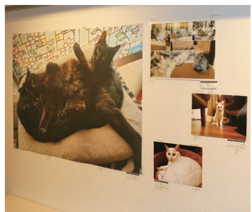
▲自慢の猫ちゃん達をご覧ください

6月15日から8月29日(予定)までの間、栃木市蔵の街市民ギャラリー(旧とちぎ蔵の街美術館)にて、「うちの猫ちゃんが一番かわいい選手権」を初開催中。猫好きのみなさんが自由に持ち寄った、選りすぐりの猫ちゃん写真を展示しています。「うちの猫ちゃんが一番かわいい」に決まっているので、展示された方全員が最優秀賞!蔵の街市民ギャラリーは、常時入館無料ですので、ぜひ猫ちゃんの写真を持ってお越しください。