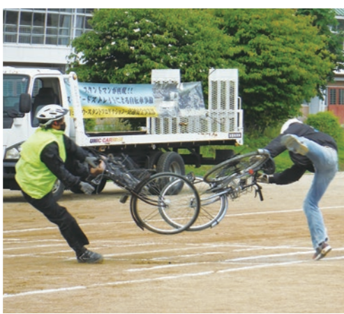
▲プロのスタントマンによる事故の再現

6月10日、プロのスタントマンが実際の交通事故を再現する、「スケアードストリート方式」による交通安全教室が岩舟中学校校庭で行われました。