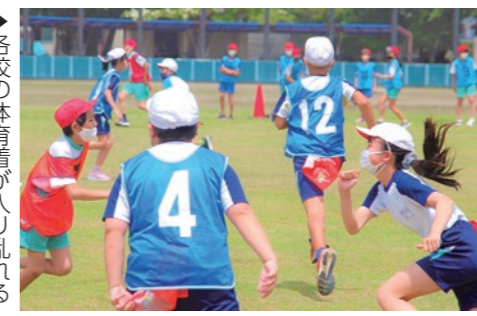
▶各校の体育着が入り乱れる「しっぽ取りゲーム」

6月1日、大平運動公園において、大平地域4校の小学6年生が一堂に会し、以前行われていた陸上交歓会から、より仲間と楽しむことを目的にした、スポーツ交流会が行われました。大平中学校区(東小・西小)、大平南中学校区(南小・中央小)ごとに、小学校の枠を超えたチームを編成し、「しっぽ取り」などの団体戦を楽しみました。