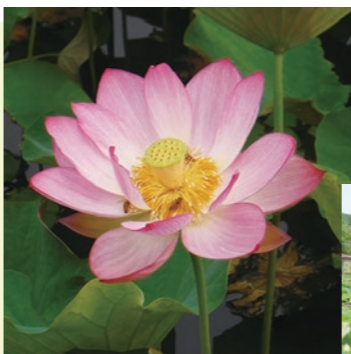
▲花に誘われる ミツバチにはご注意ください