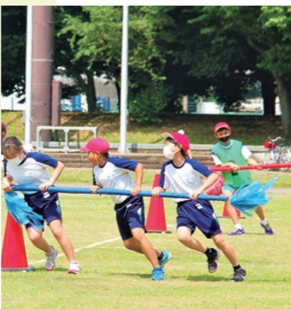
▲息を合わせて!「台風目」