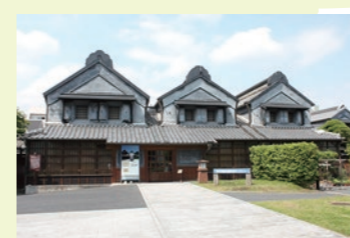
▲蔵の街市民ギャラリー

6月15日から8月29日(予定)までの間、栃木市蔵の街市民ギャラリー(旧とちぎ蔵の街美術館)にて、「うちの猫ちゃんが一番かわいい選手権」を初開催中。猫好きのみなさんが自由に持ち寄った、選りすぐりの猫ちゃん写真を展示しています。「うちの猫ちゃんが一番かわいい」に決まっているので、展示された方全員が最優秀賞!蔵の街市民ギャラリーは、常時入館無料ですので、ぜひ猫ちゃんの写真を持ってお越しください。