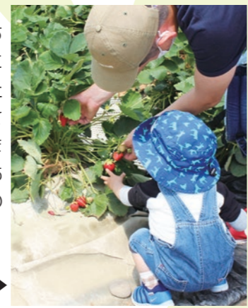
◀みなさんいちごの摘み取りに夢中です▶

6月5日、西方小学校周辺のいちごハウスを会場に栃木市実働組織「にしかたわくわく隊」の主催でにしかたいちご祭りが開催され、大人から小さなお子さんまで約450人が参加しました。今年も、スカイベリーやとちあいかを箱いっぱい摘んで、大満足の日でした。