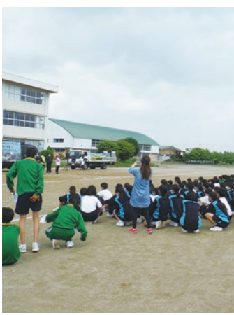
▲事故の衝撃と怖さを実感する生徒たち

この教室は、昨年度の岩舟地域会議で提案され、今年度実施されました。全校生徒の目の前で自転車同士などの衝突場面を再現。生徒たちはその衝撃と怖さを実感し、交通ルールを守ることの重要性を再認識しました。