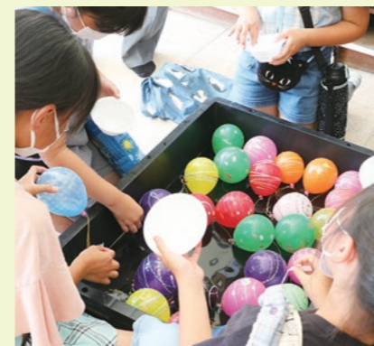
▲カラフルな水ヨーヨーすくい

7月20日、皆川城東小学校にて、『絆～皆川わっしょいまつり～』が開催されました。このイベントは、皆川中学校の生徒が中心となり、小学生に楽しんでもらえるようにと企画・運営されました。コロナ禍で、学校行事が今までのようにできない中、小中学生に楽しい思い出作りができるように、皆川地域アシストネットや地域ボランティアが支援。小学生はもちろん運営に携わった中学生やボランティア、みんなが笑顔になれる素敵な一日となりました。