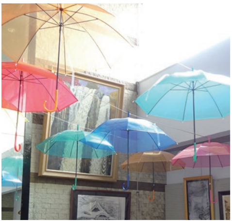
▲アンブレラスカイ