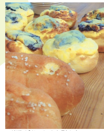
▲岩塩がおいしさを引き立てるドイツパン