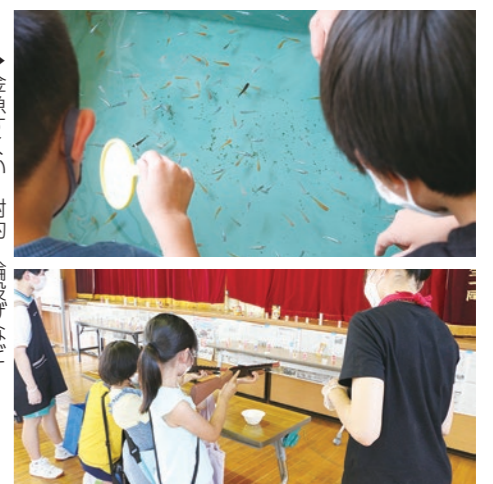
▶金魚すくい・射的・輪投げなど 学校がおまつり会場に様変わり