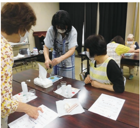
▲分量を正確に量って…