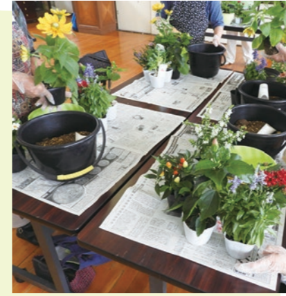
▲どういふ風に植えるか考えるのも楽しいですね♪