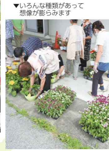
▼いろんな種類があって想像が膨らみます

7月20日、都賀公民館でとちぎ花センターの鈴木氏を講師に招き、夏の花の寄せ植え講座が開催されました。一つの植木鉢等に数種類の花を植えて楽しむガーデニングの一つですが、花の種類、大きさ・バランスや色あいなど植えた鉢には個性が光ります。青・紫・白といった花は夏の暑さに涼を感じさせ、赤・オレンジ・黄色の花は見た人を元氣ハツラツにしてくれます。みなさん好きな花を選んで、和氣あい笑顔いっぱいこの講座でした。