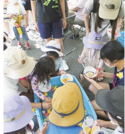
▼大人気！スーパーボールすくい

7月9日、岩舟公民館や岩舟文化会館等で、岩舟地区社会福祉協議会や岩舟の子育て団体などが主催の「こどもフェスティバル」が開催されました。各会場で、マリオンネットや人形劇、縁日コーナー、ワークショップ体験などさまざまなイベントが行われ、多くの親子連れが参加し楽しい一日を過ごしました。