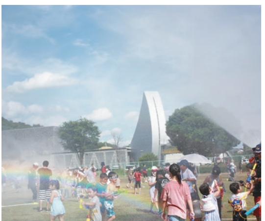
▲びしょぬれタイム vs 消防団