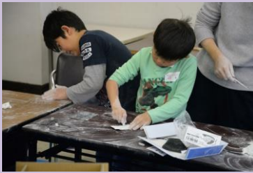
⑤ 手造りおもちゃ・勾玉