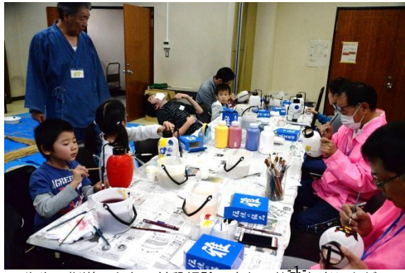
先生の指導のもと、普段経験できない体験を楽しんだ。

子どもたちの心の成長には、地域での豊かな体験が不可欠です。生活体験や自然体験が豊富な子ども、家庭でお手伝いをする子どもほど道徳観・正義感が充実すると言われています。核家族が進んだ現代では、子どもたちの「生きる力」を社会全体で育んでいくことが必要とされています。そこで、藤岡子ども会育成会連絡協議会では、藤岡地