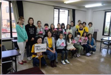
③ フラワーアレンジ