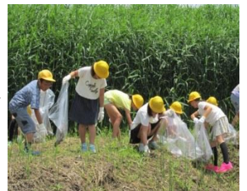
7/1 特定外来種除去作業（三鴨小）

小・中学生が、現地において野鳥や昆虫等の専門家の説明を受けたり、絶滅危惧種保全活動（特定外来種除去作業や、実際にヨシズを編んだりヨシ紙を漉くなどの体験活動を行いました。また、工事中の排水機場の見学などにも学びました。