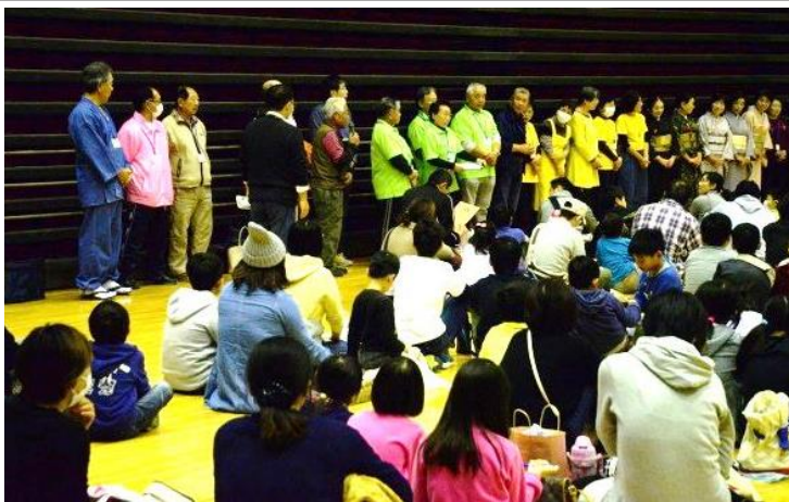
子どもたちのために指導して下さった先生方