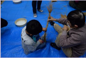
④ しめ縄・提灯絵付け