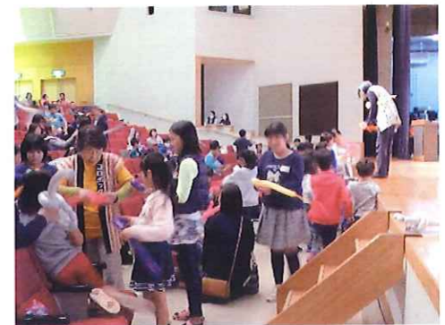
みんなで作ったバルーンアート

見守り活動を行いました。2月に予定されている「初市祭」においても、補導員と一緒に、子どもたちの安全を守るため見守り活動を実施する予定です。