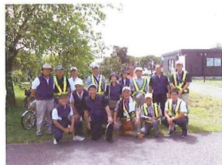
9/3 わたフェス会場において

夏休み中や休日等にたくさんの方が集まる場所は、子ども達にとって貴重な経験ができる絶好の場ですが、時にあまり好ましくない誘惑が起こりうる場所にもなります。そこで藤岡子どもネットワークでは、藤岡地域の補導員と協力し、夏休み及び9月3日の渡良瀬遊水地フェスティバル(わたフェス)会場において、巡回