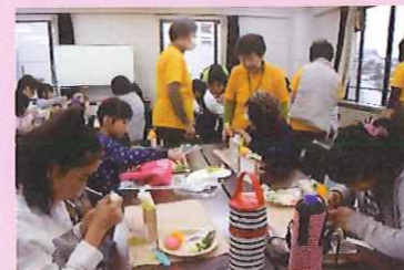
⑥フラワーアレンジ