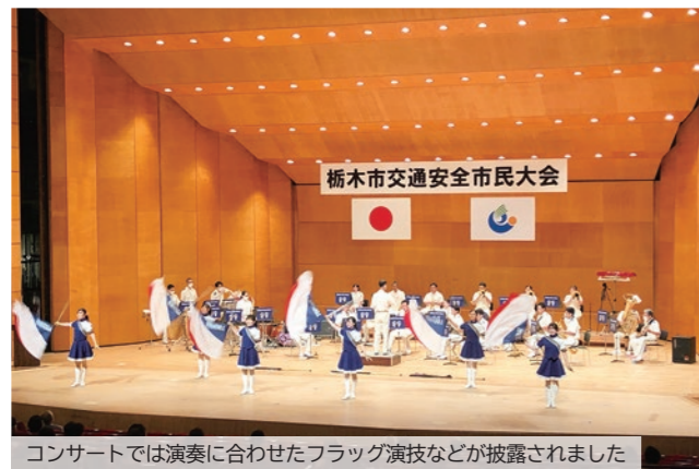
コンサートでは演奏に合わせたフラッグ演技などが披露されました