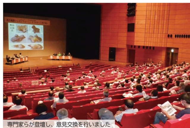
専門家が登壇し、意見交換を行いました

9月23日、とちぎ岩下の新生姜ホールにて「令和4年度栃木市交通安全市民大会」を開催しました。秋の交通安全県民総ぐるみ運動にあわせ、市民の皆さんの交通安全意識を高め、交通事故防止を呼びかけるため、例年9月に開催しています。第1部の式典では、交通事故等の現況報告や市内小学校児童2名による交通安全に関する作文の朗読、第2部では栃木県警察音楽隊&カラーガード隊のコンサートが行われました。