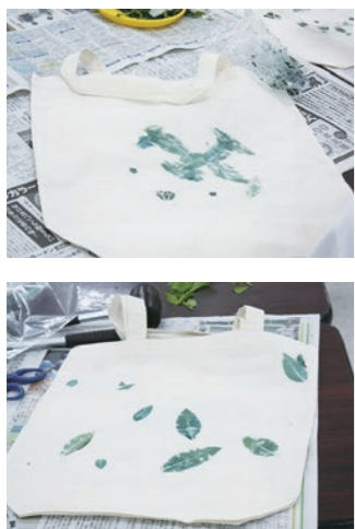
▲出来上がった作品