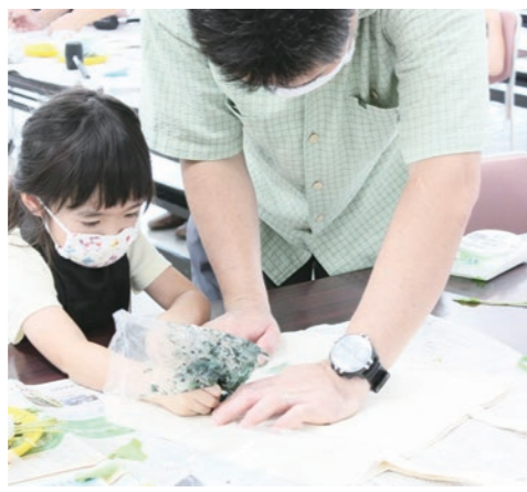
▲親子で楽しむ作品作り

8月28日、岩舟公民館において、「いわねチャレンジ工房」藍のたき染め体験教室が開催されました。たき染めは、植物のタデアイの葉をつぶし、その葉を使ってトートバックにたき染めしていくもの。とちぎ花センターの職員から説明を受けた後、親子で作品作りに打ち込みました。葉の形を活かしたり、デザインシートを使用して自分だけのオリジナルバックを作りました。