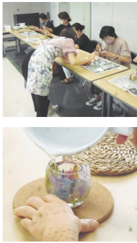
▶ドライフラワーをガラスに入れて