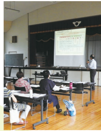
▲ 講座の様子 ▲

今の食事は栄養バランスが適切かどうか。改善するには何が 필요한のか、お話の中で参考になることがいっぱいでした。参加された皆さん、本当に熱心に受講されていました。