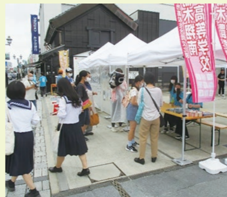
▲様々な年代の方が会場を訪れました

9月18日、「とちぎ高校生蔵部」主催の「第5回栃木市高校生合同文化祭」が3年ぶりに開催されました。今年は市内5つの高校が参加し、書道作品や星座プラネタリウム等の展示・各種研究発表等を行いました。また、クイズラリーやアートイベントなど来場者が参加できるイベントも開催しました。当日は、あいにくの雨模様となり、終了時間を1時間繰り上げましたが、文化祭後には交流会を開催し、高校生が他校の生徒とも親睦を深めました。