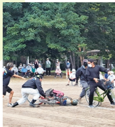
▲気をつけたい自転車事故