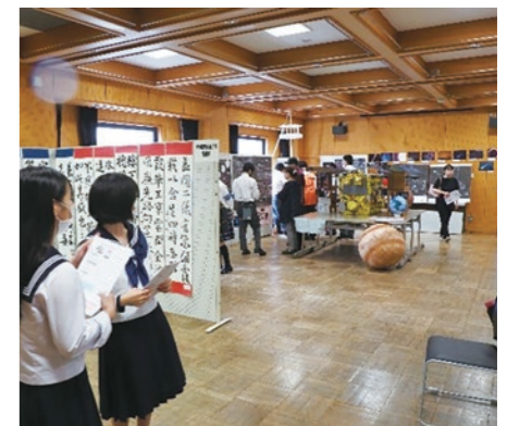
▲にぎやかな会場の様子

9月18日、「とちぎ高校生蔵部」主催の「第5回栃木市高校生合同文化祭」が3年ぶりに開催されました。今年は市内5つの高校が参加し、書道作品や星座プラネタリウム等の展示・各種研究発表等を行いました。また、クイズラリーやアートイベントなど来場者が参加できるイベントも開催しました。当日は、あいにくの雨模様となり、終了時間を1時間繰り上げましたが、文化祭後には交流会を開催し、高校生が他校の生徒とも親睦を深めました。