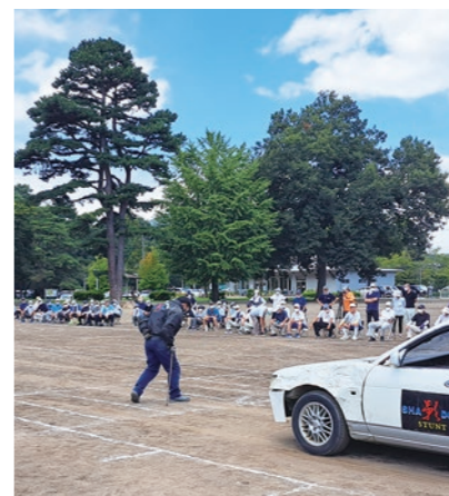
▲横断歩道にも危険が潜んでいます

今年度は、とちぎ蔵の街シニアクラブ連合会大平支部グラウンド・ゴルフ大会（およそ120人が参加）と同時開催され、参加された方々は、プロのスタントマンによる交通事故の再現を目の当たりにし、交通事故の怖さと交通ルールの大切さを実感していました。