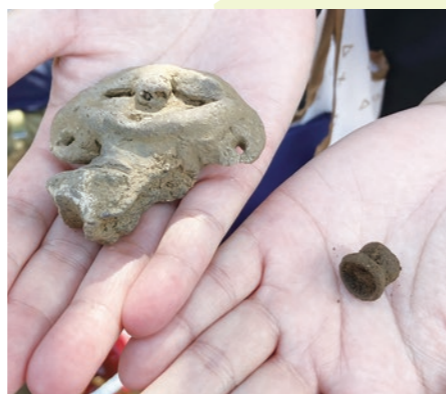
▲出土した土偶と耳飾り

藤岡地域にある「中根八幡遺跡」で縄文時代後期の土偶の顔の部分がきれいな形で見つかりました。この遺跡は、2015年度から國學院大學栃木短期大学と奈良大学が共同で発掘調査を行っています。これまでも様々な年代の土器や建物の跡などが多数見つかり、数千年にわたり縄文人がここを生活の場としていたことがうかがわれます。写真は今まさに出土したばかりの土偶と耳飾りです。