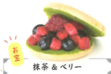
抹茶 & ベリー

特製のマスカルポーネ抹茶餡にたっぷりのベリー。エスプレッソとの相性もGOOD! ③ 380円 A wakura cafe [倭町 6-8]