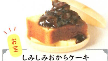
しみしみおからケーキ

ラムレーズンの風味豊かな特製アイスにフルーツチャツネとグラノーラ。甘味同士が重なる美味しさ。 ③ 330円 B 工藝と喫茶物華 [嘉右衛門町 1-12 内]