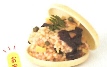
寝かせ玄米おこわ

艶よく焼き直した最中種に、特製ラムレーズンバターをサンド。リッチで濃厚な味わい。 ④ 400円 ※アルコールを含みます。 G Rainbow Food Lab (キッチンカー) 出店場所はお店のInstagramで確認ください。