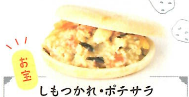
しもつかれ・ポテサラ

店長のひらめきで、マロン餡と塩豆をプラス。ソフトの甘味が際立つ、冷んやりもなか。 ③ 350円 C コエド市場 [倭町 13-2] 他に、お宝コーヒー花豆