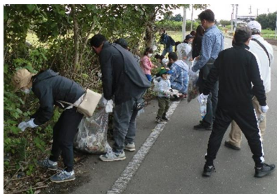
力を合わせて地域をきれいにしました

◆赤麻地区クリーン作戦◆ 10月9日(日)、ハートランドまちづくり隊では3年ぶりとなるクリーン作戦を実施しました。 今回は藤岡地域内の赤麻小学校周辺において実施し、当日は、会員の他、地元自治会の方や赤麻小学校の児童・保護者など97名が参加し、みなで力を合わせ周辺のごみを拾いました。 ハートランドまちづくり隊では、今後も藤岡地域を活気づけるいろいろな事業を企画運営していく予定です。