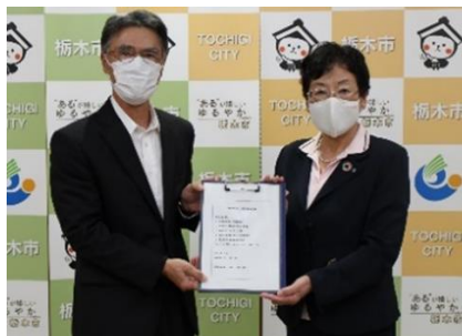
片柳会長(左)から大川市長(右)へ計画の実現が託されました。

10月7日に、藤岡地域会議を代表し片柳会長が市長に対して地域予算事業計画書を提出し、令和5年度中の実施を求めました。