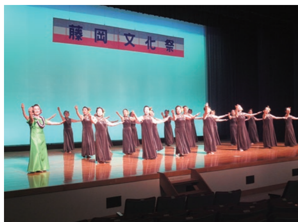
▲ 練習の成果を発表

10月30日、11月5日および6日の3日間、藤岡文化会館と藤岡公民館において、藤岡文化団体連絡協議会による藤岡文化祭が開催されました。3年ぶりとなる今回の文化祭、参加した団体の皆さんは体験コーナーや展示、ステージ上で日々の成果を来場者に発表し、大いに盛り上がりました。