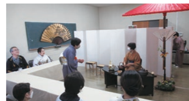
▲ 大人気のお茶席体験コーナー