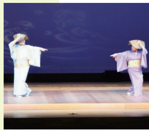
▲ 艶やかな舞踊の舞台