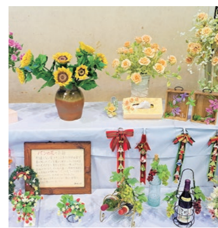
▲ 色鮮やかなパンフラワー