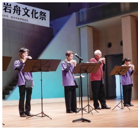
▲ 日頃の練習の成果を披露しました