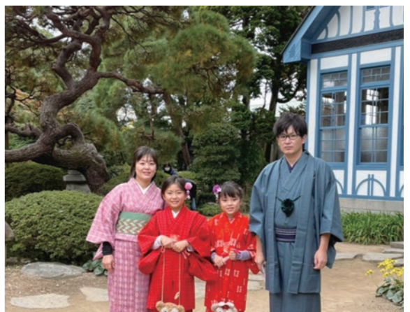
まるで江戸時代ヘタイムスリップしたようです ▲