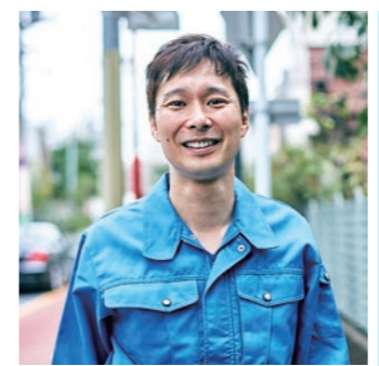
マシンガンズ 滝沢秀一氏