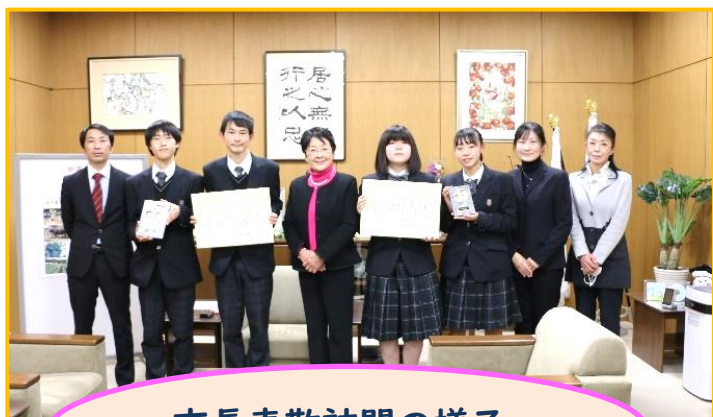
市長表敬訪問の様子

12月16日(金)に栃木農業高等学校の生徒さんが市長表敬訪問を実施し、活動に対する熱い思いを説明してくださいました。