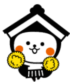
栃木市マスコットキャラクター とち介

12月10日(土)に栃木県庁で行われた表彰式に参加しました。今後も、継続して連携を図っていきますので、ご期待ください！