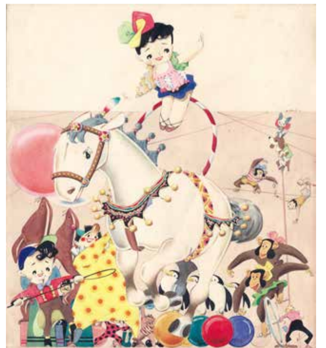
写真図版:松本かつぢ《くるみちゃんサーカス》昭和28年(1953)松本かつぢ資料館蔵 ©松本かつぢ

※( )内は、20人以上の団体割引料金 ※身体障害者手帳、療育手帳、障害者保健福祉手帳の交付を受けている方とその介護者1人は無料