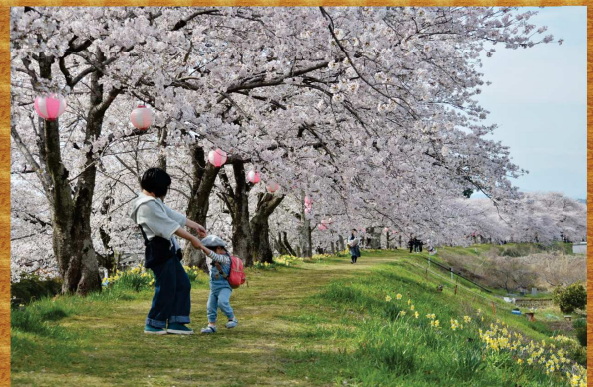
金崎のさくら賞(第4回作品)