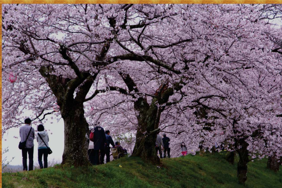
最優秀賞(第4回作品)

◎詳細については栃木市HPをご覧ください。 (栃木市HP http://www.city.tochigi.lg.jp/ イベントカレンダーから検索してください)