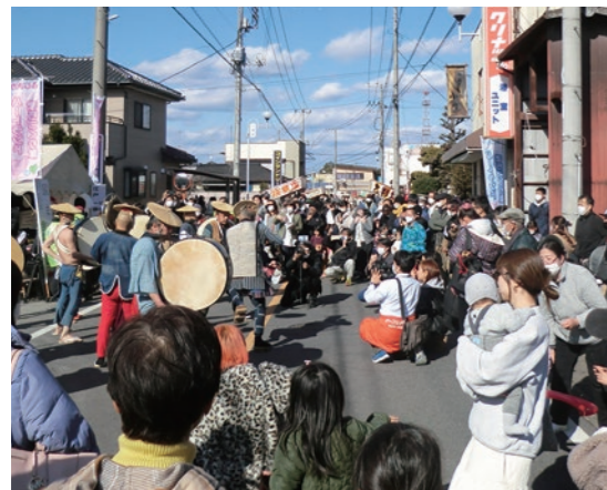
▲和太鼓パフォーマンス

2月11日、藤岡中央通りで3年ぶりの開催となる「初市祭」が開催されました。当日は晴天に恵まれ、立ち並んだ出店で買い物を楽しむ人達や、道沿いに設けられたイベント会場での「和太鼓パフォーマンス」や「モンキーパフォーマンスショー」などのイベントを楽しむ人達で、藤岡中央通りは夜まで大いに賑わった1日となりました。