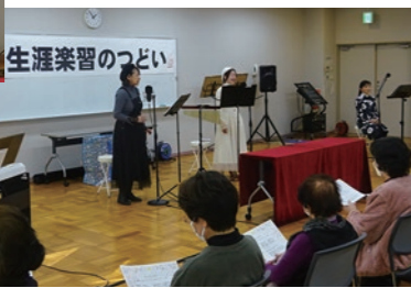
生涯楽習のつどい