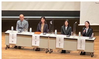
パネルディスカッションの様子

1月28日、岩舟文化会館において、栃木市PTA連合会岩舟ブロック・岩舟地域青少年育成会議主催「岩舟の子どもをみんなで育てよう」講演会が行われました。栃木県国際理解教育研究会から6人の講師を迎え、「子どもたちの豊かな国際感覚をほぐすために」をテーマに海外教育の紹介とパネルディスカッションが行われました。海外の教育を通して、日本の良さを再認識したこと、多様性を理解し他者との違いを尊重することにつながるなどの体験談に、参加者は熱心に耳を傾けていました。