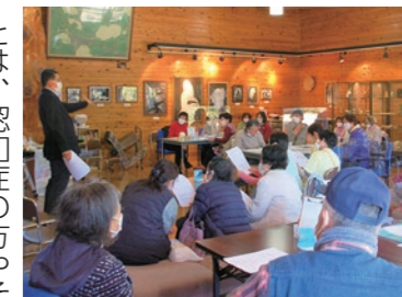
▲傾聴ボランティア、福祉関係者なども参加しています

ふるさとふれあい館のロビーで、月に2回ほど「オレンジカフェ」が開かれています。「オレンジカフェ」とは、認知症の方やその家族、地域住民の方など、どなたでも自由に参加できるつどいの場です。この日は、「栃木市ますます元気サポーター」による体操などで身も心もほぐした後、薬剤師による「お薬の正しい飲み方」のミニ講座がありました。お茶やお話をしながら、気軽に介護や認知症のことを専門家に相談したり、参加者の同士で、お互いの境遇を分かち合ったりと、誰もがほっと一息つける場となっています。ぜひお気軽にご来場ください。