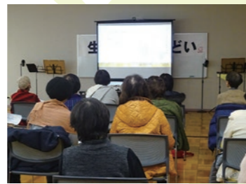
▲今年もたくさんの方が参加しました

2月4日、関東ホーチキにしかた体育館において西方公民館による「生涯楽習のつどい」が3年ぶりに開催されました。第1部では、今年度の公民館活動の振り返りとして、スライドショーにより講座などの実施報告が紹介されました。また、第2部はフレーベル・スターによる女性コーラスと読み読みのコンサートが行われました。参加した方々は、美しい歌声に耳を傾けたり、迫真の演技にびっくりして大笑いしたりと、楽しい時間を過ごしていました。