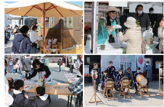
▲様々な出し物で、楽しい週末を「ちょいたし」！

2月18日、とちぎ山車会館前広場にて、栃木市フードバレー協議会が主催する『とちぎおいしい〜とこフードバレー「ちょいたし」マルシェ』が開催されました。このイベントは、栃木市フードバレー構想に掲げる「食でとちぎを盛りあげる」取組みの一つであり、会場では、協議会会員企業の製品や農業団体による農作物の物販、会員の製品を「ちょいたし」したコラボメニューを提供するキッチンカーの出店により、とちぎの食をアピール。さらに、お米・苗木の無料配布、お囃子の演奏、缶バッジの製作体験などが行われ幅広い世代の来客で賑わいました。