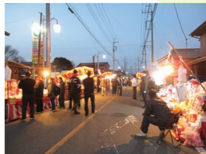
夜の初市祭の様子