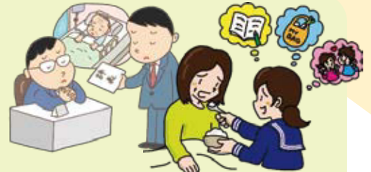
親やきょうだいなどの介護を担い、 就業や学業等に影響を及ぼす 「ケアラー」や「ヤングケアラー」 (18歳未満)