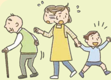
育児と介護に同時に直面する 「ダブルケア」