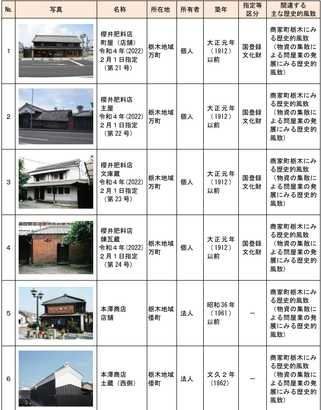
歴史的風致形成建造物指定物件及び候補物件一覧

当該重点区域において、指定及び候補となる歴史的風致形成建造物は、以下のとおりである。