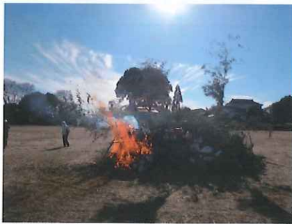
人々が見守る中、やぐらは徐々に炎に包まれていきました。