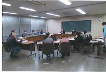
☞会議の様子 今年度最後の会議となりました。