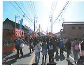
和太鼓のパフォーマンスは、人だかりができるほど大盛況でした。