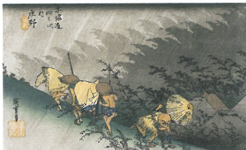
庄野 白雨 保永堂版(公財)日動美術財団蔵

歌川広重の代表作「東海道五拾三次」は、53ヶ所の宿場に日本橋と京都を加えた、全55枚の大判錦絵です。本展は、広重が最初に出版した保永堂版と晩年の丸清版の二つの東海道五拾三次を同時に展覧し、日本橋から京都までを実際に旅するように楽しんでいただきます。