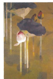
高野薫邦《蓮》紙本着色 1965年 とちぎ蔵の街美術館蔵