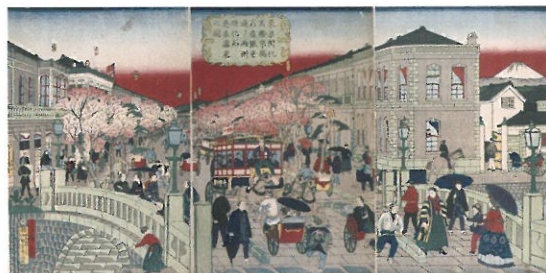
三代歌川広重《東京開花名勝京橋石造銀座通り両側煉瓦商家盛栄之図》1874年 浅井コレクション