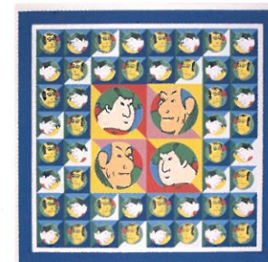
深沢史朗《Sharaku+and+1+-+749》1974年 栃木県立美術館蔵