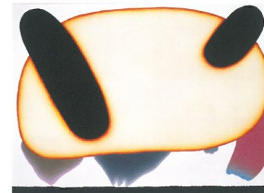
元永定正《はに、はに》1978年 栃木県立美術館蔵

アートリンクとちぎ2016は、栃木県立美術館の所蔵品を県内の美術館などで展覧し、広く紹介するものです。本展は、現代美術作家の作品から「線」と「かたち」をテーマにした作品、約40点を展覧します。さまざまな「線」と「かたち」の表現をお楽しみください。