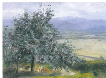
刑部人《りんごみのる》油彩・キャンバス 1955年頃 とちぎ蔵の街美術館蔵