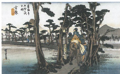
吉原 左富士 保永堂版(公財)日動美術財団蔵