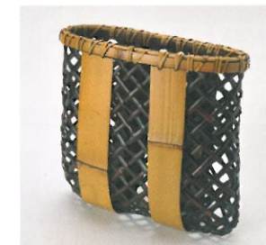
飯塚小玗齋《かけ花籃 銘 蕉夫》1953年頃 とちぎ蔵の街美術館蔵