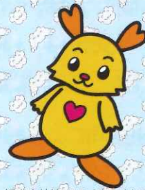
栃木市社協マスコットキャラクター びーちゃん