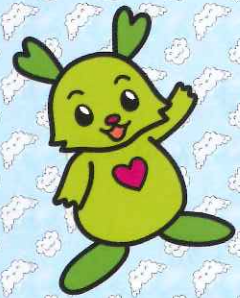
栃木市社協マスコットキャラクター ふつくん