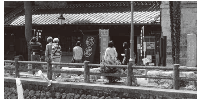
昨年度の会場の様子

蔵の街とちぎが映画の街となる2日間。街歩きを楽しみつつ、普段の映画館とは違った雰囲気での上映をお楽しみください。とちぎ山車会館前などでイベントも行われます。 日時 5月13日(土)〜14日(日) 上映会場 栃木県立栃木高等学校講堂ほか計9か所(予定) チケット 1,000円で2日間見放題(学生・未就学児無料) 栃木市観光協会、イープラスにて好評販売中(当日は各上映会場でも販売)※無料会場あります。 問合先 栃木・蔵の街かど映画祭実行委員会(観光振興課内) ☎(21)2374