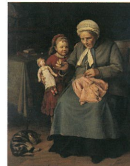
五姓田義松《人形の着物》1883年 笠間日動美術館蔵

本市ゆかりの橋本邦助(1884～1953)をはじめ、明治から現代に活躍した画家たちが主に油彩画で描いた様々な女性像を通して、明治以降、日本の絵画に見られた人体像の変化を近代絵画の変遷とともに約50点の作品で紹介いたします。