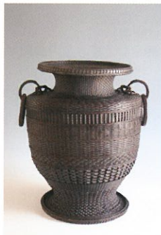
《花籃》明治末期 とちぎ蔵の街美術館蔵

現在の栃木市に生まれた竹工芸家・二代飯塚鳳齋(1872～1934)は、国内外の博覧会で数々の賞を受賞しました。本展では二代飯塚鳳齋の生誕145年を記念し、明治後期から昭和初期にかけて竹工芸界で活躍した二代鳳齋の活動を約50点の作品から振り返ります。