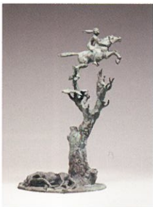
鈴木徹《馬と娘の恋の物語 6》1980年代 とちぎ蔵の街美術館蔵

平成28年度の新収蔵品の中から、鈴木賢二(1906～1987)が物を売る人たちの姿を描いた木版画作品110点を中心に、賢二の長男・徹(1935～1994)が遠野物語のオシラサマ伝説から創を得た連作彫刻などあわせて約120点を前期・後期に分けて展示します。