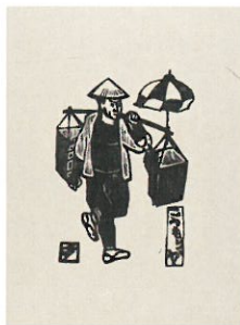
鈴木賢二《こうもりや》1966年頃 とちぎ蔵の街美術館蔵