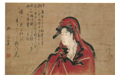
喜多川歌麿《女達磨図》1790～93年頃 とちぎ蔵の街美術館蔵

併設展として、とちぎ蔵の街美術館が所蔵する喜多川歌麿の肉筆浮世絵「女達磨図」「三福神の相撲図」「鍾馗図」、田中一村(1908～1977)の没後40年を記念して一村が鹿児島県奄美大島で撮影した写真など約10点を前期・後期に分けて紹介します。