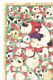
歌川国利《志んばんねこ尽》1890年