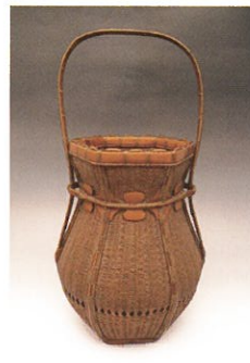
《恵比寿籃》昭和初期 とちぎ蔵の街美術館蔵