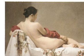
森本草介《微睡の時》1984年 笠間日動美術館蔵