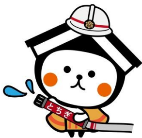
栃木市マスコットキャラクター とち介

岩舟地域会議の平成 30 年度の年間活動予定及び地域会議の開催日程について検討しました。