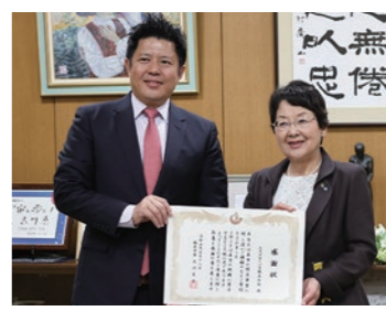
消防ポンプ自動車購入のため、のた役に立ってほしいと、エネグ

美術・文学館課 ☎25)5300 企業版ふるさと納税の寄附 ありがとうございました