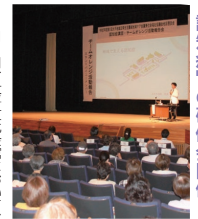
▲地域の方約150名が集まりました

また、男性介護者から、具体的な話も聞きました。コロナ禍を経て、それぞれが一人ずつ抱えている課題や悩みを共有し、手助けを求め合える大切さを実感できる報告会でした。