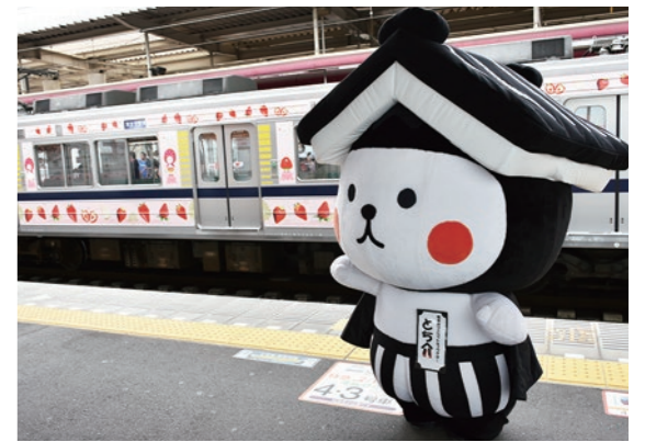
▲ベリーハッピートレインをとち介がお出迎え