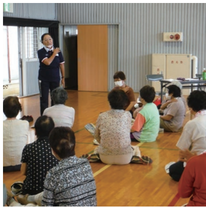
▲皆で歌いながら手を動かすのは楽しそうでした