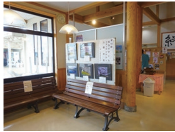
▲道の駅にしかたでの展示

5月31日、西方総合支所において、観光協会西方支部役員や西方文化協会専門部フォトクラブの代表を審査員に、第10回西方のさくらフォトコンテストの審査会が開催されました。西方町の「さくら」をテーマに、5月8日までに応募のあった作品の中から5点が入賞作品に選ばれました。これらの作品は、6月23日～7月24日、道の駅にしかたのレストラン待合所に展示されます。また、来年3月から4月中にも展示を予定しています。