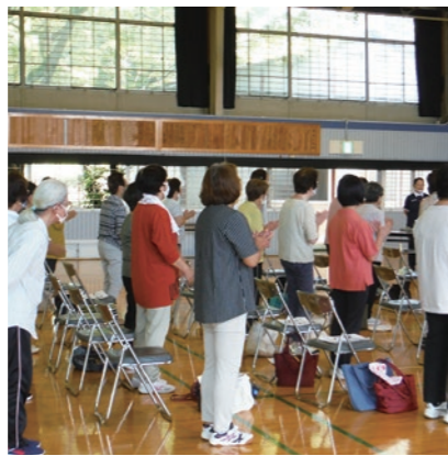
▲脳を活性化するトレーニング「コグニサイズ」

岩舟公民館講座(高齢者教室)が開催されました 6月16日、岩舟公民館講座いきいき教室(高齢者教室)「健康な生活を送るために」毎日元気で楽しく過ごしましょう」が、岩舟校・小野寺校・静和校の三校合同で岩舟体育館において開催されました。日本赤十字社栃木県支部から講師2名をお招きし、事故予防や認知症の方への対応方法などを学びました。脳を活性化するトレーニングなども盛り込まれ、受講者の皆さんは熱心に耳を傾け、いきいきと受講されていました。