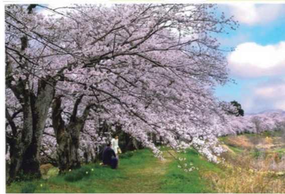
▲最優秀作品に選ばれた「今日は最高」