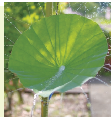
▲水が踊りだすハスの葉シャワー