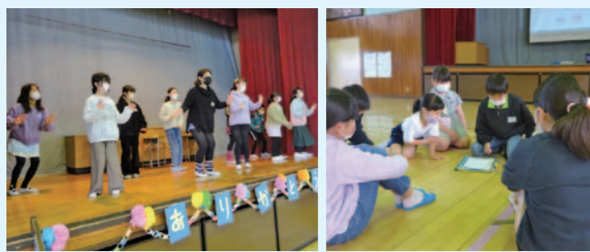
《6年生を送る会のようす》