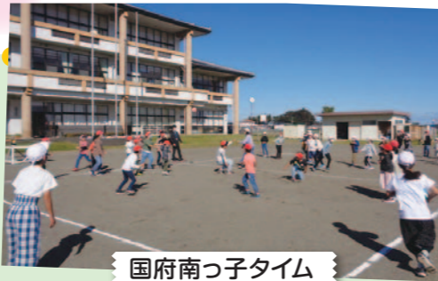
国府南っ子タイム