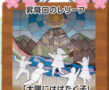
昇降口のレリーフ