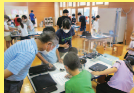
コンポスト活動 サイエンスラボ↑