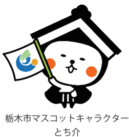
栃木市マスコットキャラクター とち介