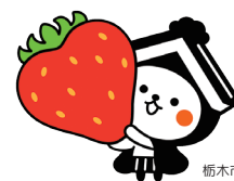
栃木市マスコットキャラクター とち介