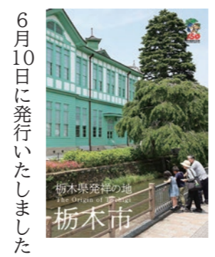
6月10日に発行いたしました