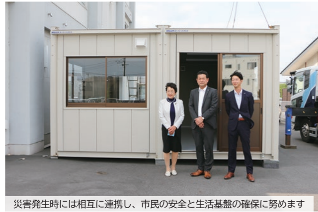
災害発生時には相互に連携し、市民の安全と生活基盤の確保に努めます