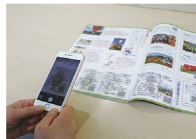
栃木市のホームページ ▼練習用2次元コード