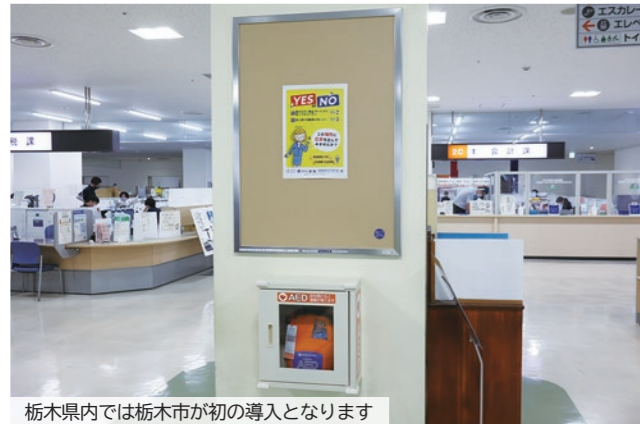
栃木県内では栃木市が初の導入となります

開運橋周辺からうずま公園までの左岸、右岸に、切り絵師故川島雅舟氏が作成した、蔵や山車、円仁などの切り絵を貼り付けた行灯を124基設置し、夏の夕べを幻想的に彩ります。