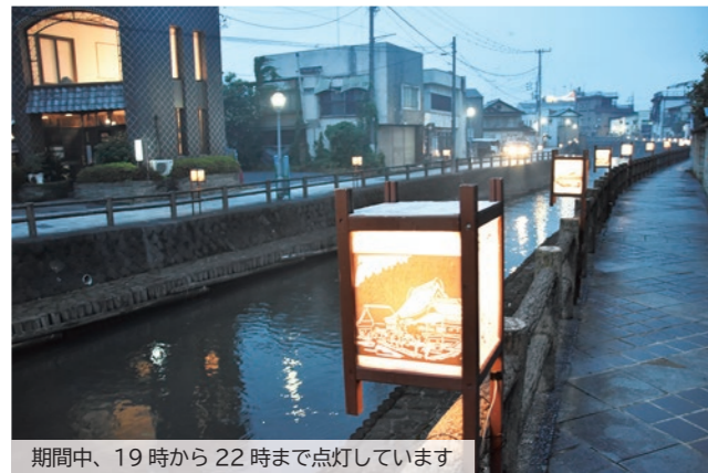
期間中、19時から22時まで点灯しています

会社のメイン事業であるユニットハウスに加えて、発電機や水中ポンプ、ストーブ、仮設トイレなど、保有する機材の優先的な提供など、大規模災害時に幅広い支援を受けられる協力体制を整えました。