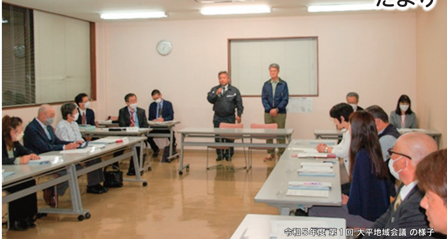
令和5年度 第1回 大平地域会議の様子