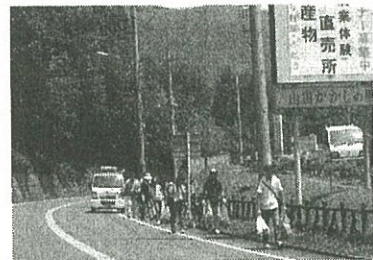
とち介がきます！！ トウートゥー体操の上原千 さんもきます！！