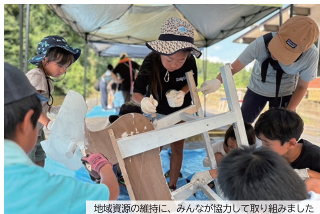
地域資源の維持に、みんなが協力して取り組みました

吹上地区まちづくり協議会の子どもロマン委員会が、市内唯一のアイススケート場「宮スケートセンター」の備品を整備するワークショップ『みんなでリメイク 宮スケートセンター』を開催しました。参加した子どもたちは長年使用されてきたパイプ椅子をリメイクしたり、新たな遊具として、乗って遊べる白い木馬を作りました。製作された備品は、冬になるまでしばらくお別れ。オープン後のスケートセンターでの再会をお楽しみに。