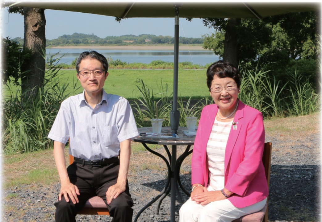
対談は7月末に、前半は谷中湖を望む遊水地で、後半は市ハートランド城で開催

環境の目的・役割ももつようになりませんが、登録以前の経緯を認識しておく必要があります。利根上では、2000年に遊水地の環境の将