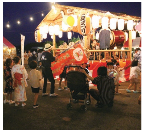
▲やぐらではお囃子が会場を盛り上げます

8月19日、関東ホーチキにしかた体育館にて「にしかた子ども夏まつり」が開催されました。今年は、なかよし子ども園の園児たちによる元気いっぱいのお神輿から始まり、屋内・屋外の会場でミニゲームや模擬店、様々な体験コーナーが設けられ、大勢の参加者で賑わいました。夕方からは、やぐらを中心に盆踊りが行われ、まつりのフィナーレには、美しい花火が夜空を彩りました。