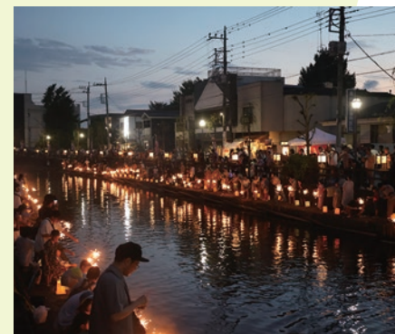
▲同時開催の「鎮魂線香花火と灯ろう流し」の幻想的な光景

8月6日、蔵の街大通りを中心に栃木県誕生 150 年記念「蔵の街サマーフェスタ 2023」が開催されました。スーパーカー & ハーレーの展示にはじまり、メインステージでは、ブラスバンドの演奏やお囃子、ダンス、よさこい等が行われました。