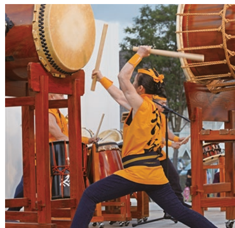
▲武蔵太鼓の和太鼓演奏

TSUGA盆が開催されました 8月5日、都賀市民運動場で第46回TSUGA盆が開催されました。4年ぶりの開催となったTSUGA盆は、お囃子・ダンス・盆踊り・抽選会など数々の催しが行われ大賑わい。 盆踊りでは、お囃子の音に合わせ大人も子どもも輪になり踊る様子が夏を実感させます。お祭りの最後を飾る花火大会も、笑顔と歓声に包まれ、大盛り上がりイベントとなりました。