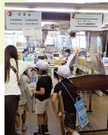
▲多くのポスターや書類に興味深々

大平地域内の小学2年生が、大平総合支所へ「町たんけん」に来てくれました。グループごとの元気なあいさつのもと、大平総合支所内の各窓口や書庫を見学。「どんなお仕事していますか」「何人くらい働いていますか」など、考えてきた質問をたくさんしてくれました。 また、持参のタブレットで庁舎内の写真を撮るときには、来庁している市民の方が映り込まないように注意していました。さすが、今どきの小学生です。