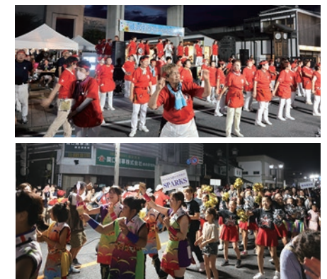
▲令和元年以来、4年ぶりの開催となりました

クライマックスは、蔵の街サマーフェスタでは恒例の「蔵踊り」。多くの参加者が一丸となって踊り、夏の暑い夜に、熱く盛り上がりました。