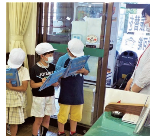
▲一生懸命メモを取る小学生

大平地域内の小学2年生が、大平総合支所へ「町たんけん」に来てくれました。グループごとの元気なあいさつのもと、大平総合支所内の各窓口や書庫を見学。「どんなお仕事していますか」「何人くらい働いていますか」など、考えてきた質問をたくさんしてくれました。 また、持参のタブレットで庁舎内の写真を撮るときには、来庁している市民の方が映り込まないように注意していました。さすが、今どきの小学生です。