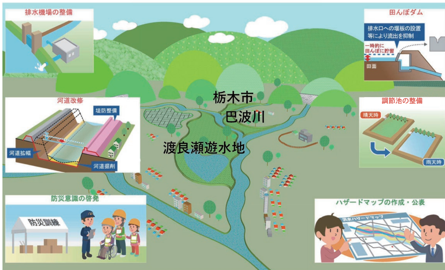
※図示されている取り組みは代表例です。