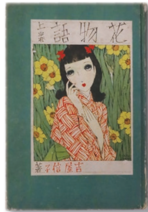
吉屋信子 『花物語 上巻』 吉屋信子記念会蔵