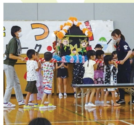
▲みんなで息を合わせてお神輿を担ぎました

8月19日、関東ホーチキにしかた体育館にて「にしかた子ども夏まつり」が開催されました。今年は、なかよし子ども園の園児たちによる元気いっぱいのお神輿から始まり、屋内・屋外の会場でミニゲームや模擬店、様々な体験コーナーが設けられ、大勢の参加者で賑わいました。夕方からは、やぐらを中心に盆踊りが行われ、まつりのフィナーレには、美しい花火が夜空を彩りました。