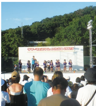
▲いわふね保育園年長ぞうぐみの音頭

サマーフェスタinいわふね 2023開催 8月11日、岩舟総合運動場において、サマーフェスタinいわふね2023が開催されました。 いわふね保育園児の音頭、ダンス、和太鼓など数々の催しが行われ、子ども広場ではたくさんのお子さんがボールプールなどで楽しそうに遊んでいました。フィナーレでは、夜空を彩る打上花火を見た来場者は歓声をあげていました。