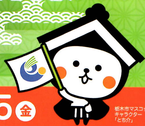
栃木市マスコット キャラクター 「とち介」