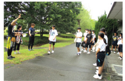
▲中学生ボランティア