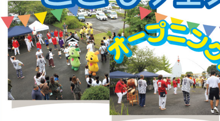
▲新里お囃子保存会の皆さん