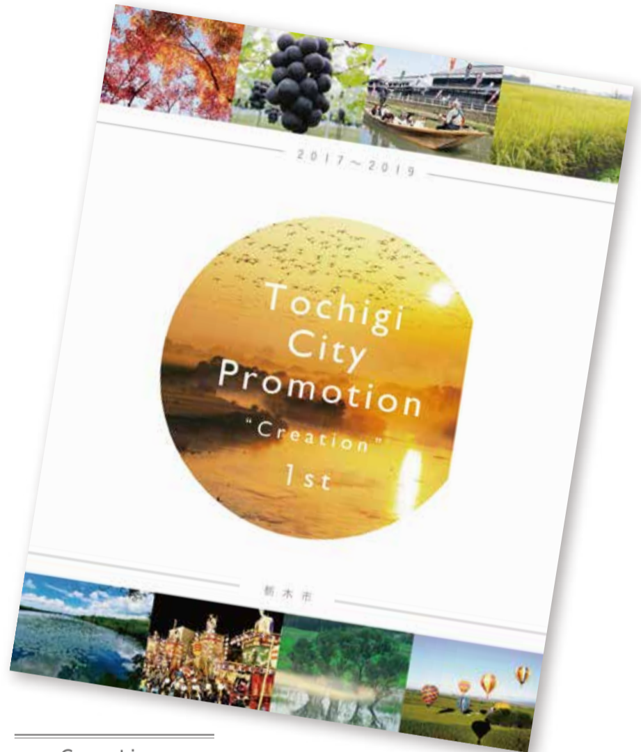
Creation (クリエイション) 具体性 1st 2017~2019(3年間)