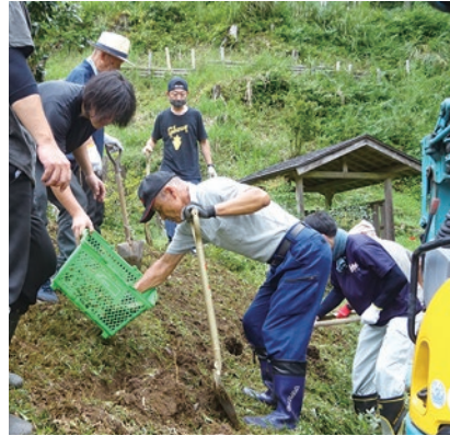
▲急な斜面にも植え付け

9月10日、西方町真名子地区にある八百比丘尼堂の周辺に、ヒガンバナの球根1,000個を植え付ける作業が行われました。地域予算提案事業の一つで、八百比丘尼堂周辺の景観を整備し、より魅力のある観光拠点とすることで地域の活性化につなげようとするものです。地元自治会や、地域会議委員、まちづくり実働組織わくわく隊等から約30人の皆さんが参加しました。開花は来年以降になる見込みです。