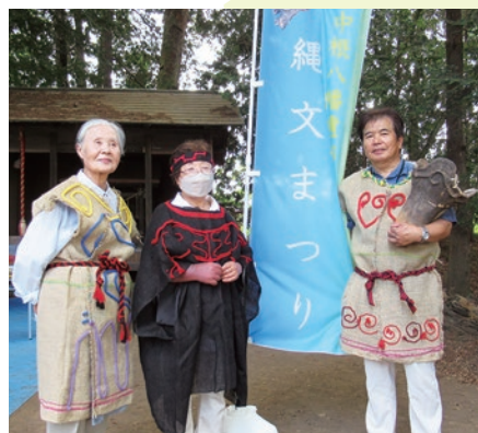
▲縄文時代の再現衣装。とてもお似合いです！

藤岡地域の中根八幡遺跡では、國學院大學栃木短期大学と奈良大学が共同で発掘調査を行っています。9年目となる今回は、発掘調査の現地説明会に加え、縄文時代を体験できる「縄文まつり」が開催されました。石器で肉を切り土器で煮込んだ縄文なべの試食や、縄文時代の音楽や土器の文様付けの体験、縄文時代の服を再現した試着コーナーなど、参加者の皆さんは思い思いに縄文時代を楽しんでいました。