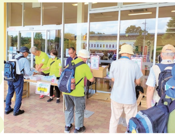
▲ゴール受付。おつかれさまでした！