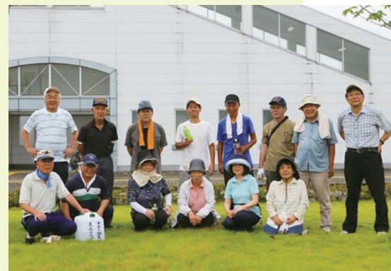
▲「新栃木駅東口美化クラブ」の皆さん

新栃木駅東口のロータリーでは、八重桜や寒椿、百日紅、サツキなど、四季折々の花を楽しむことができます。これは植栽を管理する近隣の有志市民で構成する『新栃木駅東口美化クラブ』による毎月第3土曜日のボランティア活動（4月～9月）のおかげです。美化クラブに参加する皆さんは、「景観がきれいになると気持ち良くて、作業は大変ですけど、身体を動かすことは健康にも良いですよ。」「作業をとおして、地域の輪が広がるので嬉しい。」など笑顔で話してくれました。