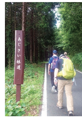
▲緑の中、汗をふきふき進みます

歩こう！大平里山ハイキング！ 9月10日、栃木市観光協会企画による「健康ハイキング」が開催されました。台風13号の影響を受け、開催日程が短縮されてしまったものの、当日は、市内外から多くのハイカーが訪れました。今回歩いたのは、一面のぶどう棚の景色を楽しむことのできる太平山南山麓で、大平地域自慢のハイキングコースの一つです。ゴール地点のプラッツおひらでは、旬のぶどうの直売なども行われ、多くの人でにぎわいました。