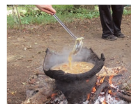
▲石器や土器で調理した縄文なべ