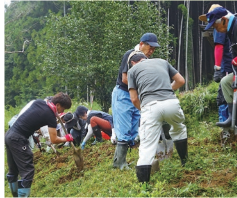
▲手分けをして作業します