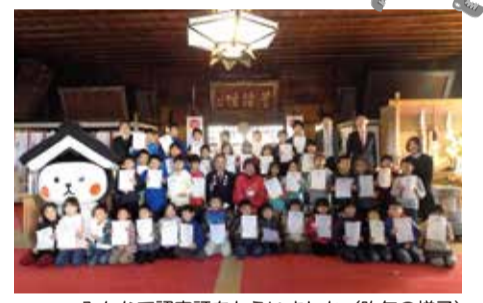
みんなで認定証をもらいました(昨年の様子)