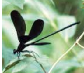
▲オオヨシキリ ▲ハグロトンボ

渡良瀬遊水地には多くの種類のトンボが生息しています。カワトンボ科の「ハグロトンボ」もそのひとつです。体長57mm、67mmと、トンボとしてはやや大型で、その名の通り真っ黒な羽を持ちます。雌は体も羽と同じ黒い色をしていますが、雄の体は黒地に緑色の金属のような美しい光沢があります。パタパタ、と小さな音を立てながら、4枚の羽根をひらひらとさせて舞うように羽ばたく姿は、まるでチョウのようです。遊水地では5〜10月に見ることができ