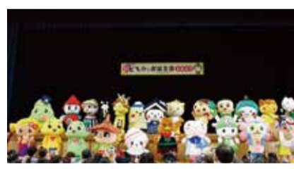
多くのおともだちにお祝いしてもらいました

4月16日、栃木市総合運動公園総合体育館にて、とち介のお誕生会が行われました。晴天に恵まれた当日は、約2,700人もの方々が会場を訪れ、全国各地から駆けつけたキャラクターたちと共に、とち介のお誕生会を祝いました。