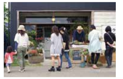
嘉右衛門町が多くの人で賑わうクラモノ

市内の嘉右衛門町重伝建地区とその周辺で行われるマルシェイベントの9回目です。レトロ感あふれる町並みと、クラフト、雑貨、古道具、飲食物や、アート、音楽等の芸術作品などをお楽しみください。