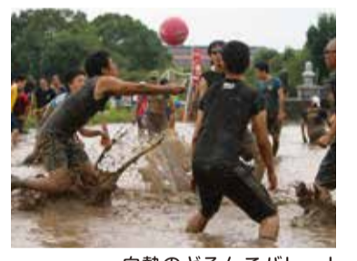
白熱のどろんこバレー!

今年も8月11日(金・祝)に、栃木市総合運動公園北側園場にて開催!参加申し込みなどの詳細は、どろんこバレーホームページへ。どろんこフラッグレースやどろんこキッズ宝さがしなど、当日参加OKの無料イベントもあります。