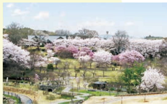
▲ 数種類の桜が咲き乱れるつがの里

2017 つがの里花彩祭 4月1日から16日まで、つがの里花彩祭2017が開催されました。土・日曜のつがの里では、ゆるキャラじゃんけん大会、野外音楽祭、ヒーローショーなど多彩なイベントが開催され、市内外から訪れた多くの来場者で賑わっていました。