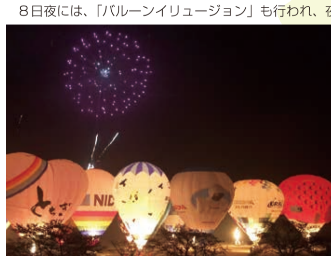
◀ BGMに合わせた光の演出

4月7日から9日まで、藤岡渡良瀬運動公園を主会場に「渡良瀬バルーンレース2017」が開催されました。