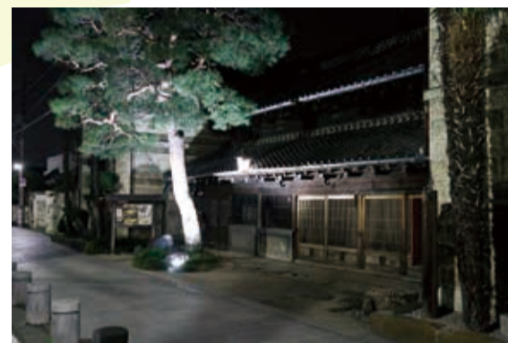
▲ ライトアップされた横山郷土館