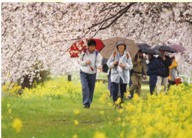
▲ 満開の桜と菜の花の中を歩く参加者

桜も見頃となった4月9日、西方地域の桜の名所を巡るウォーキングスタンプラリーが開催されました。雨が降るあいにくの天候の中、桜グラウンドをスタートした参加者らは、コース内各所の見ごたえのある桜を満喫しながら、ゴールとなる道の駅にしかたまでの約10kmのウォーキングを楽しみました。