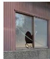
窓が割れた 管理不全空家