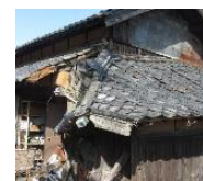
緊急代執行を要する 崩落しかけた屋根