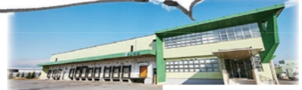
株式会社 上原園 様

従業員のSDGsの意識向上、市の取り組みに共感し、社内でアイデアを募集しました。サステナブルな社会の実現につなげたいです。