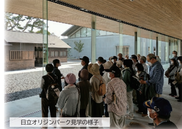
日立オリジンパーク見学の様子

株式会社日立製作所の創業者であり、郷土の偉人・先人である小平浪平を顕彰するとともに、ものづくりへのこだわりや新規創業に向けての开拓者精神および郷土への愛着と誇りを醸成するため、小平浪平生誕地および日立オリジンパーク等の見学ツアーを実施します。